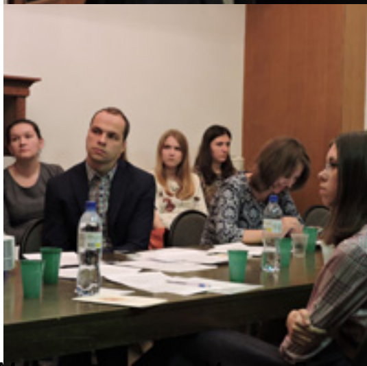
Место проведения: Москва, Ленинский пр., д. 32А, Институт славяноведения РАН